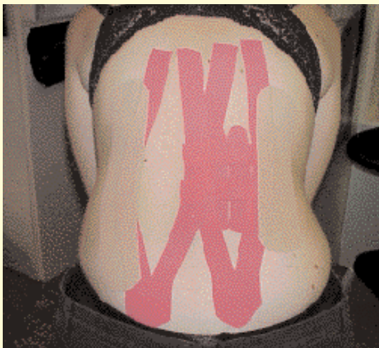
Pretensione della parte da trattare due nastri ad Y sostegno con la tecnica dello spazio, e due nastri laterali