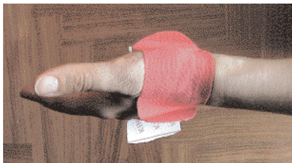
La terza tecnica si effettua con un nastro largo 5 cm della lunghezza di circa 10 cm,... con il primo dito in massima opposizione sul palmo, si posiziona il nastro con la tecnica dello spazio in corrispondenza dell'articolazione. Successivamente si adagia il nastro senza trazione con il primo dito in massima abduzione - nastratura completata.