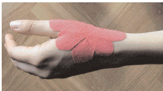
Nella tecnica "della stella" si pone il centro della stella in corrispondenza della articolazione.